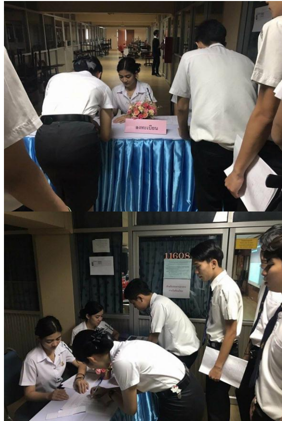
นักศึกษาและคณาจารย์ลงทะเบียนก่อนเข้ารับฟังคำบรรยาย

ณ ห้อง 11608 อาคาร 11 ชั้น 6 มหาวิทยาลัยสวนดุสิต