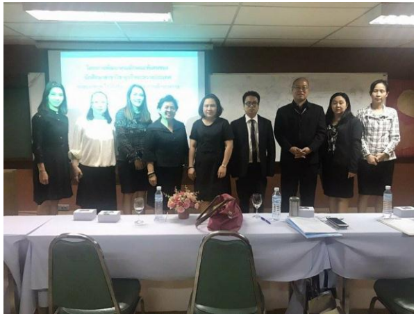
จบการบรรยายคณาจารย์และวิทยากรถ่ายภาพร่วมกัน