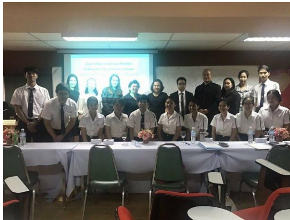
วิทยากร คณาจารย์ และตัวแทนนักเรียนร่วมถ่ายรูปร่วมกันเป็นที่ระลึก